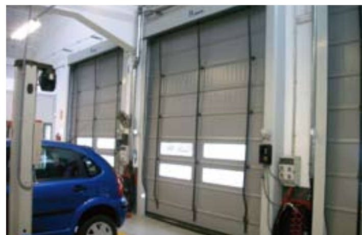
▲ Instalada en firma concesionaria de vehículos.