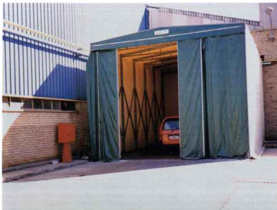
Túneles de maniobra Coberlon robustos, versátiles, extensibles y de alta resistencia